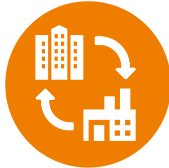
Cirkulär industri & samhälle