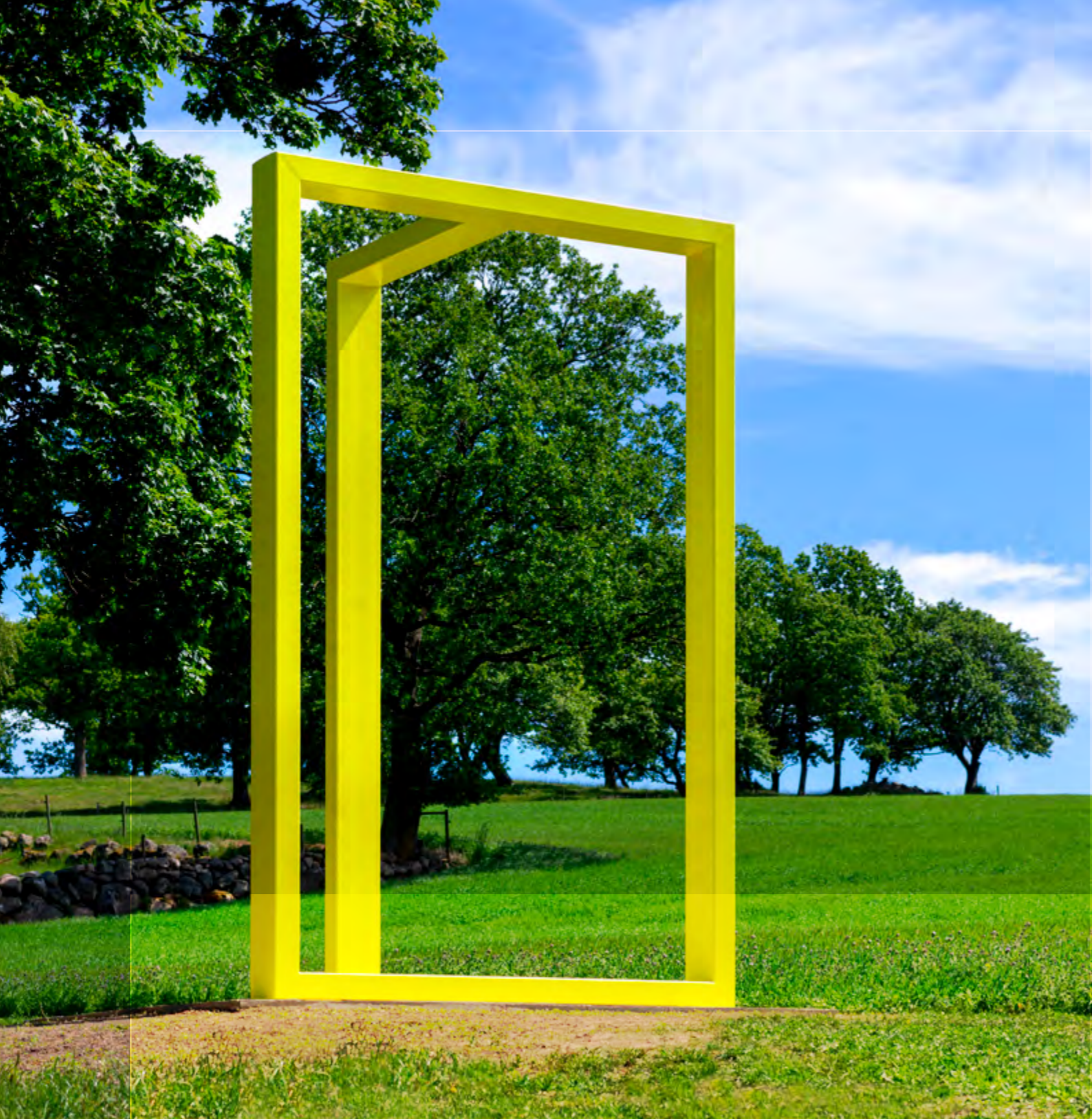
“Lyckans Portar” av Hubert Garnier på Kivik Art Center.