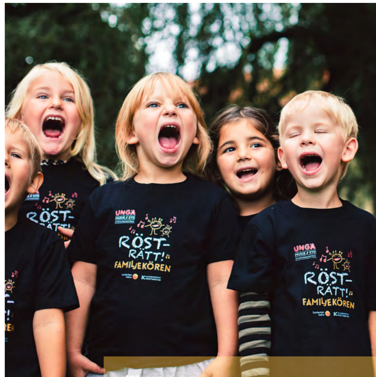
Rösträtt – sång på förskolan är ett projekt som drivs av UNGA Musik i Syd.