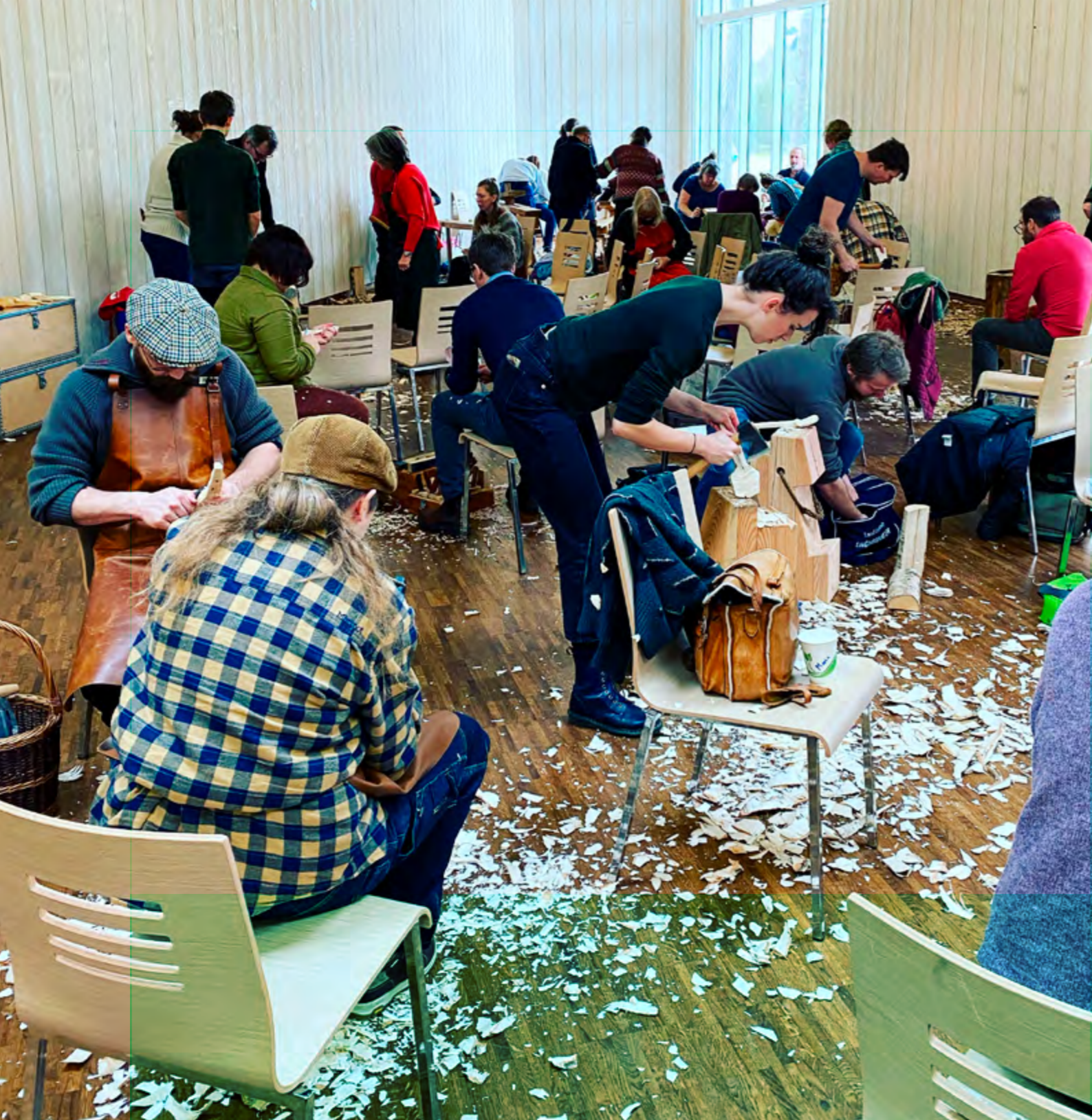
Slöjdkurs med Skånes Hemslöjdsförbund.