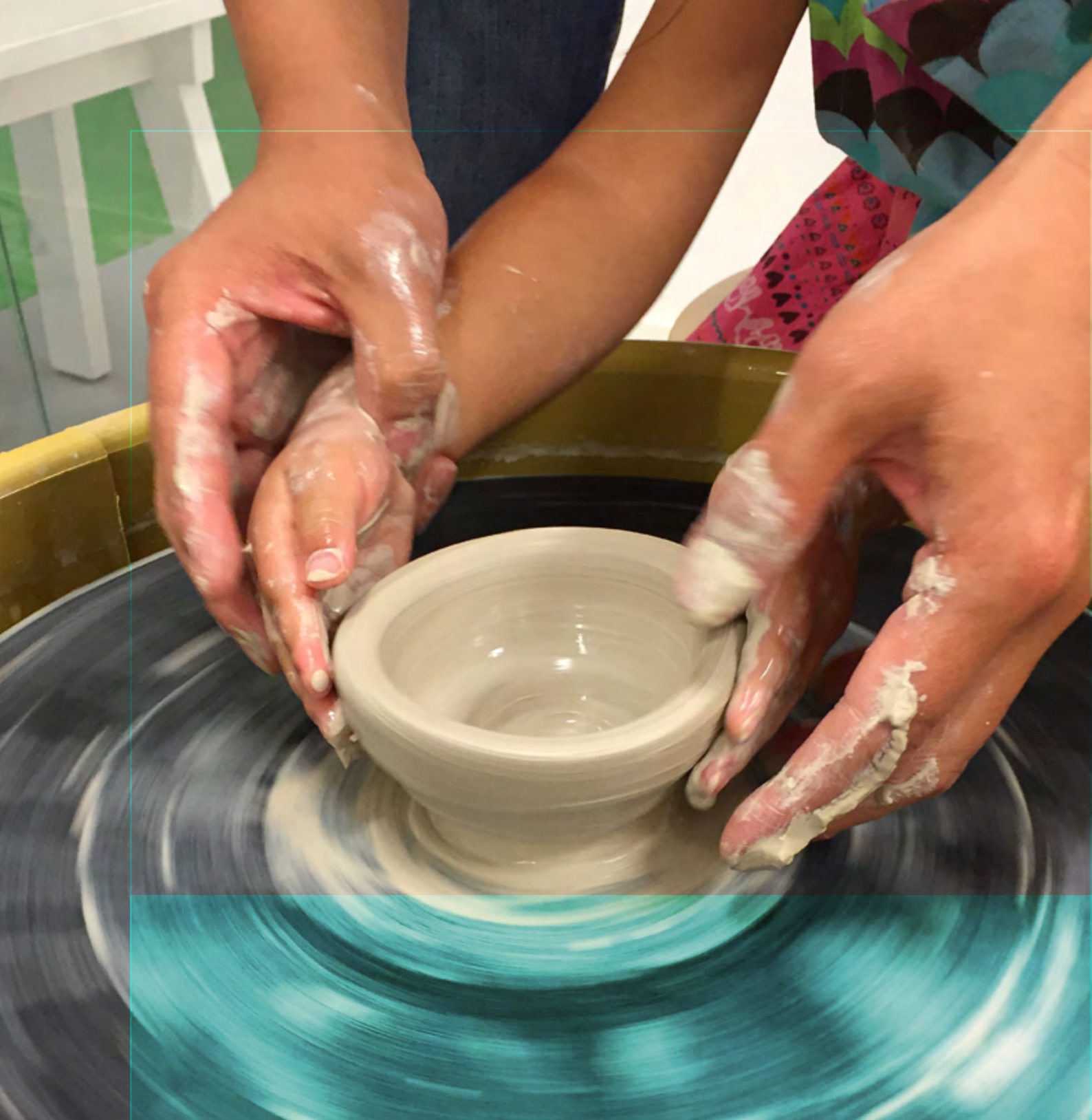
Drejning på Keramiskt Center i Höganäs.