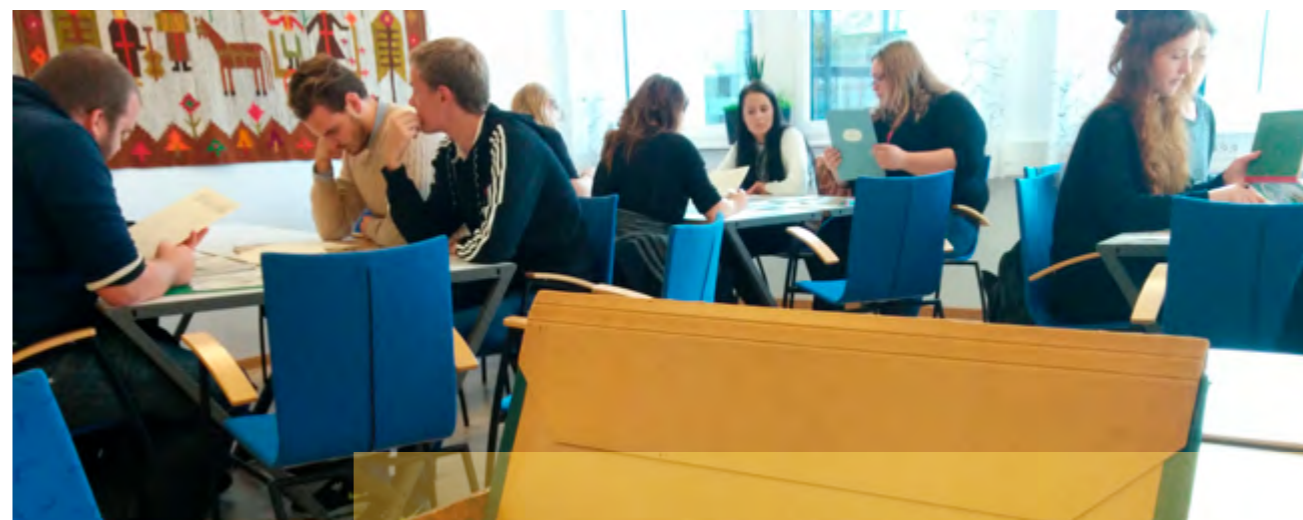
Skånes Arkivförbund arbetar för att Skånes lokalhistoria ska bevaras och vara tillgänglig för forskning.

I samarbete med universitet och högskolor initierar och stödjer Region Skåne angelägen forskning och följeforskning för att öka kunskapen inom exempelvis biblioteks- och kulturarvsområdena, gestaltad livsmiljö, kultur och hälsa, kulturella och kreativa näringar samt kultur för barn och unga. Region Skåne utgår i sin verksamhet från aktuell forskning och bevakar, sprider kunskap och följer upp forskningsresultat inom olika områden. Av särskild vikt är att fortsätta bidra till den forskningsbaserade kunskapen om tvärpolitiska och tvärssektoriella insatser.