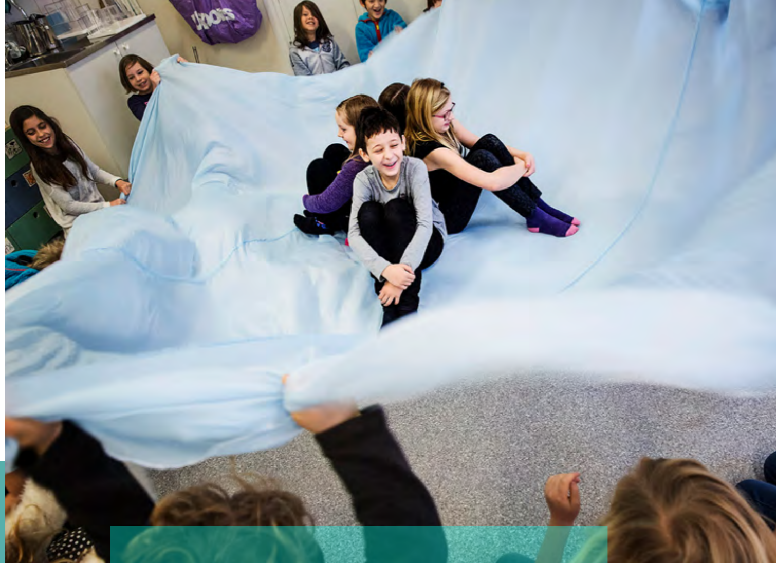
Unga Malmö Stadsteatern håller i Skapande skola-kurs på en skola.