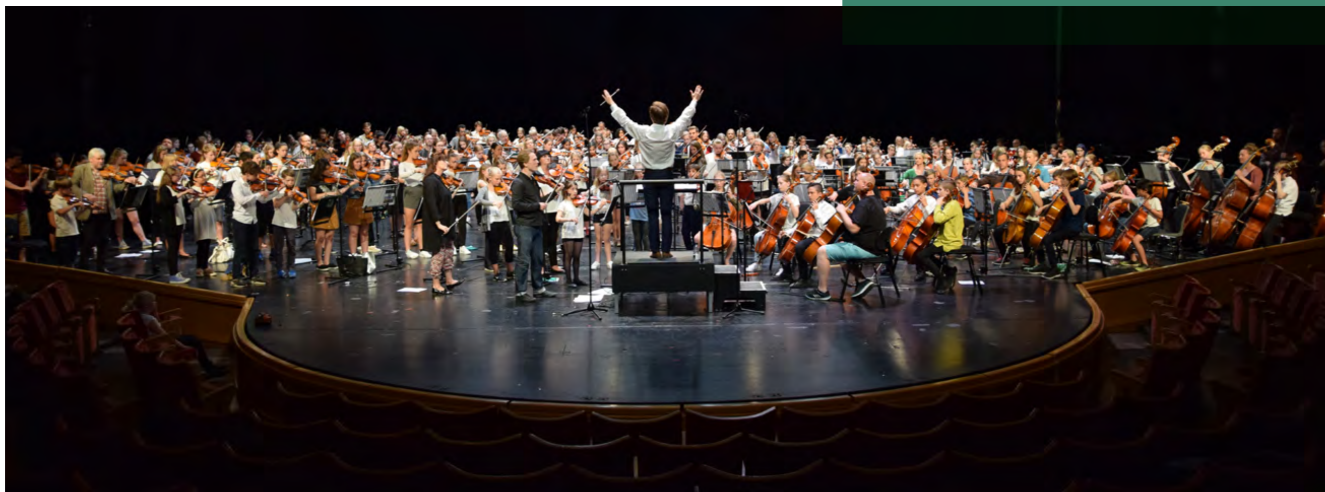
Stråkduell på Malmö Operas stora scen.

Region Skånes kulturförvaltning initierar och driver utvecklingsarbete på uppdrag av kulturnämnden. Kulturförvaltningen utformar och utvärderar insatser utifrån de kulturpolitiska målen och strategierna, samt handlägger, följer upp och utvärderar stöd till kulturinstitutioner, det fria professionella kulturlivet och kommuner samt redovisar statliga medel till Statens kulturråd.