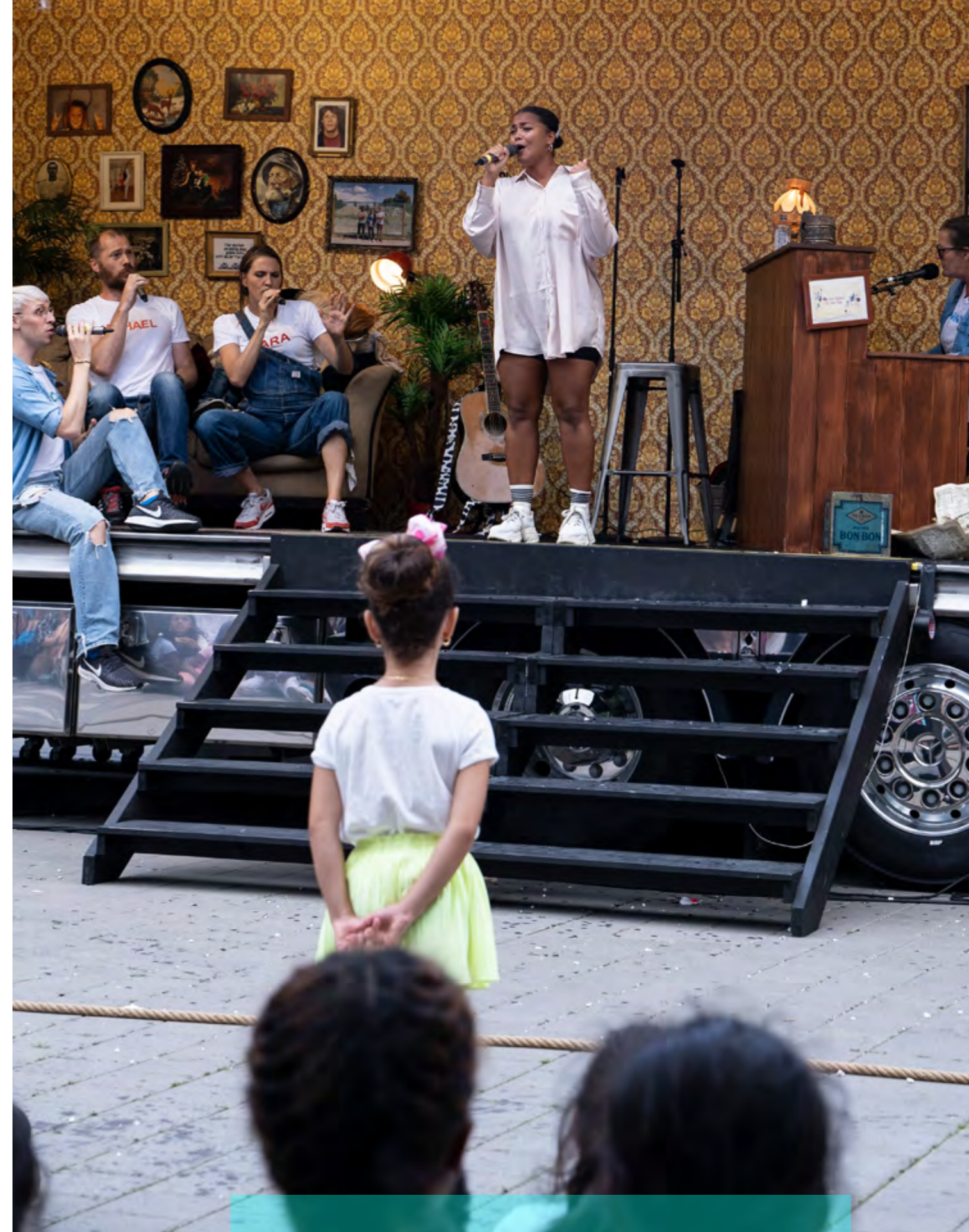
Malmö Opera på lastbilsturné i Skåne – en viktig del av deras regionala uppdrag.