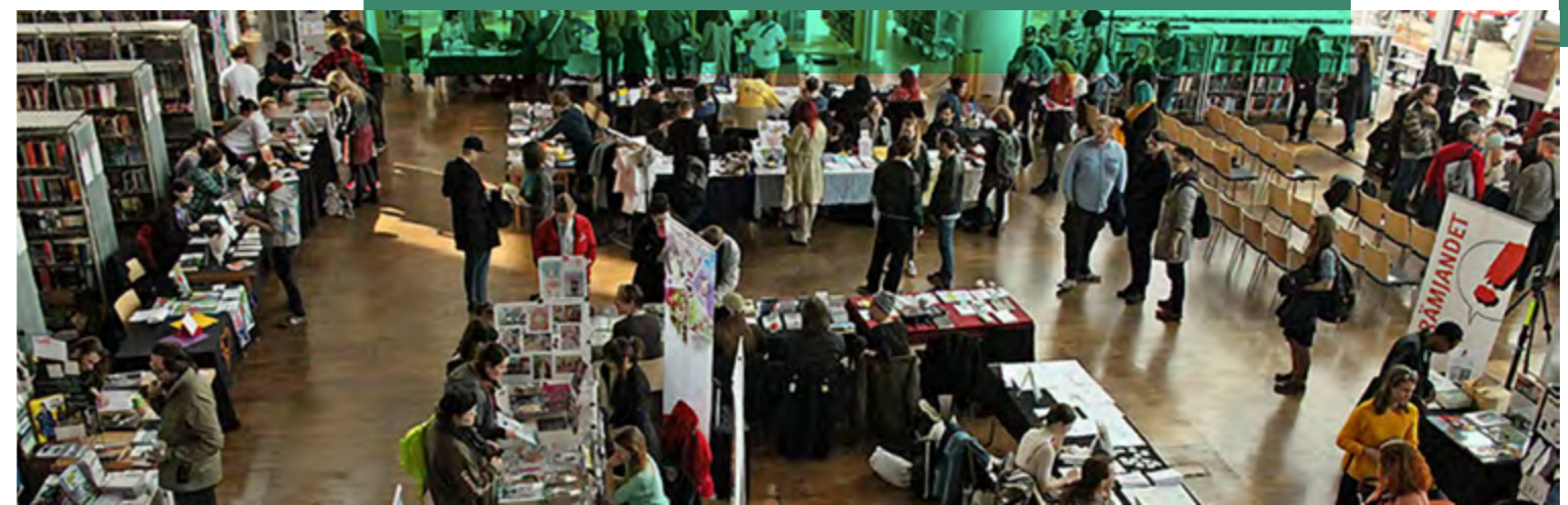
Malmö Seriefest är en seriefestival med fokus på självpublicerade tecknade serier.

Den digitala utvecklingen inom litteraturområdet innebär nya konstnärliga villkor, format och läsvanor, vilket innebär en omvandling av infrastrukturen som innefattar produktion, distribution och tillgänglighet. Läsförfrämjande och litteraturförfrämjande är varandras förutsättningar. Genom att stärka litteraturens och seriernas ställning kan Region Skåne även främja läsning.