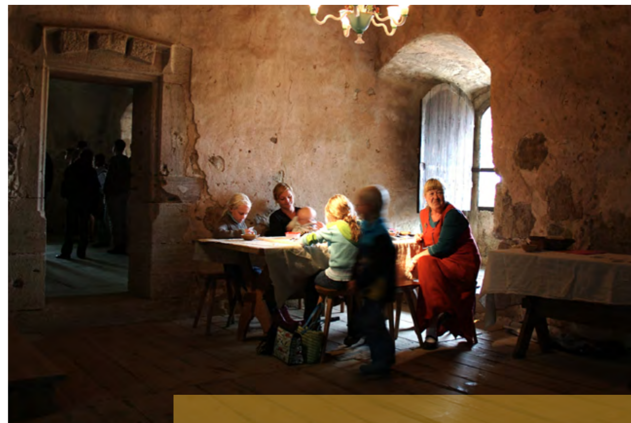
Barnvisning på Glimmingehus, nordens bäst bevarade medeltida borg.

Kommunerna står för den största delen av finansieringen av den kulturella basverksamheten som är en förutsättning för att regionens invånare ska ha tillgång till ett rikt och dynamiskt kulturliv. För att den regionala kulturplanens utvecklingsambitioner ska kunna förverkligas behöver statliga, regionala och kommunala resurser samspela.