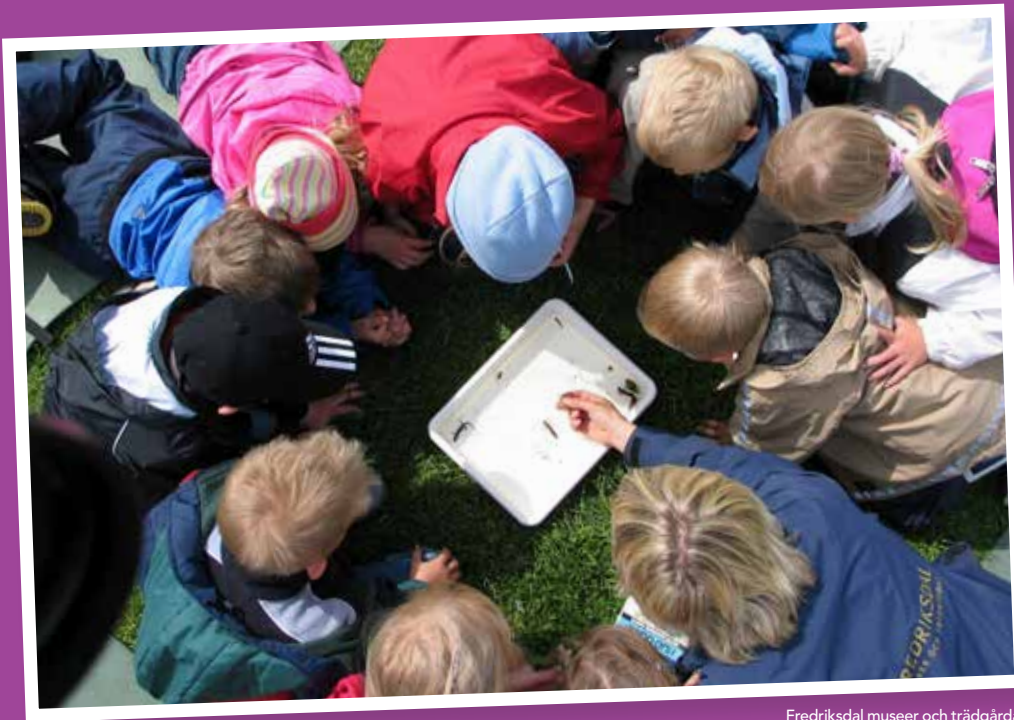
Fredriksdal museer och trädgårdar: Här undersöks småkryp med Fredriksdals pedagoger