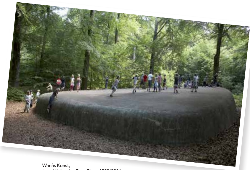
Wanås Konst, Jene Highstein, Grey Clam, 1990/2001

En central utgångspunkt för den kulturpolitiska samverkan är att parterna uppfattar sig själva och varandra som utvecklingsaktörer. I detta ingår att parterna har tydliga prioriteringar i form av kulturpolitiska program, planer och strategier.