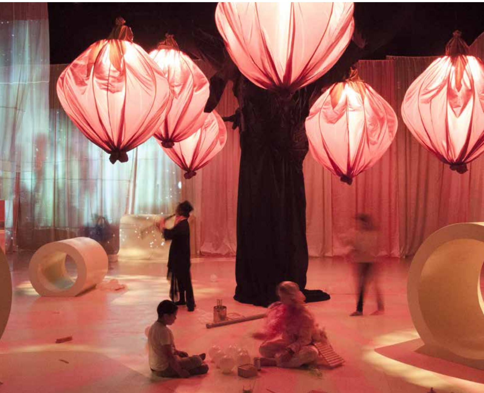
Många barn fick chansen att lyssna, leka, spela och lära i det interaktiva musikkonstverket KLONK som fyllde Kuben i Malmö Live. KLONK var en del av Bästa Biennalen som är en konstfestival för barn och unga, som hölls i Skåne hösten 2015.