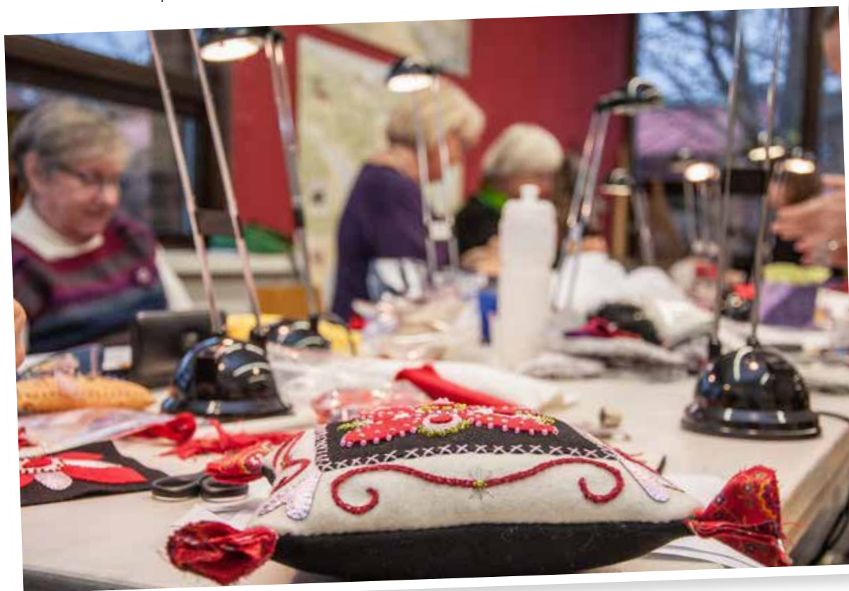
Kurs i grannlätsbroderi.

Under hösten hålls ett regionalt kulturpolitiskt möte som samlar regionala och kommunala kulturpolitiker och chefstjänstemän för att utbyta kunskap och erfarenheter inför nästkommande år.