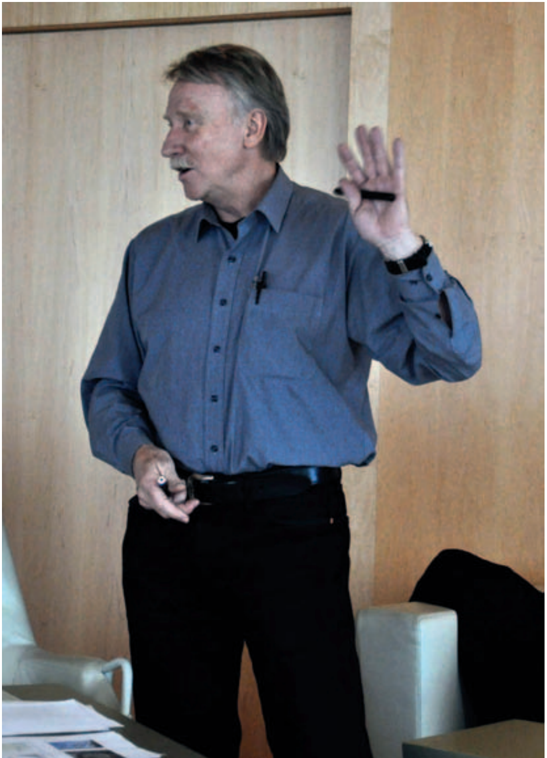
Ilmar Reepalu berättar om Malmös förvandling.