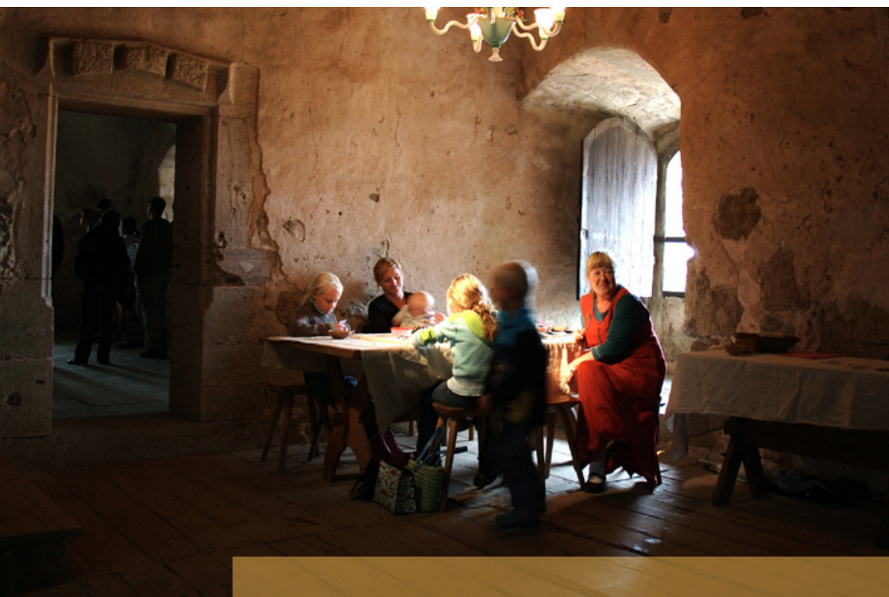
Barnvisning på Glimmingehus, Nordens bäst bevarade medeltida borg.

Kommunerna står för den största delen av finansieringen av den kulturella basverksamheten som är en förutsättning för att regionens invånare ska ha tillgång till ett rikt och dynamiskt kulturliv. För att den regionala kulturplanens utvecklingsambitioner ska kunna förverkligas behöver statliga, regionala och kommunala resurser samspela.