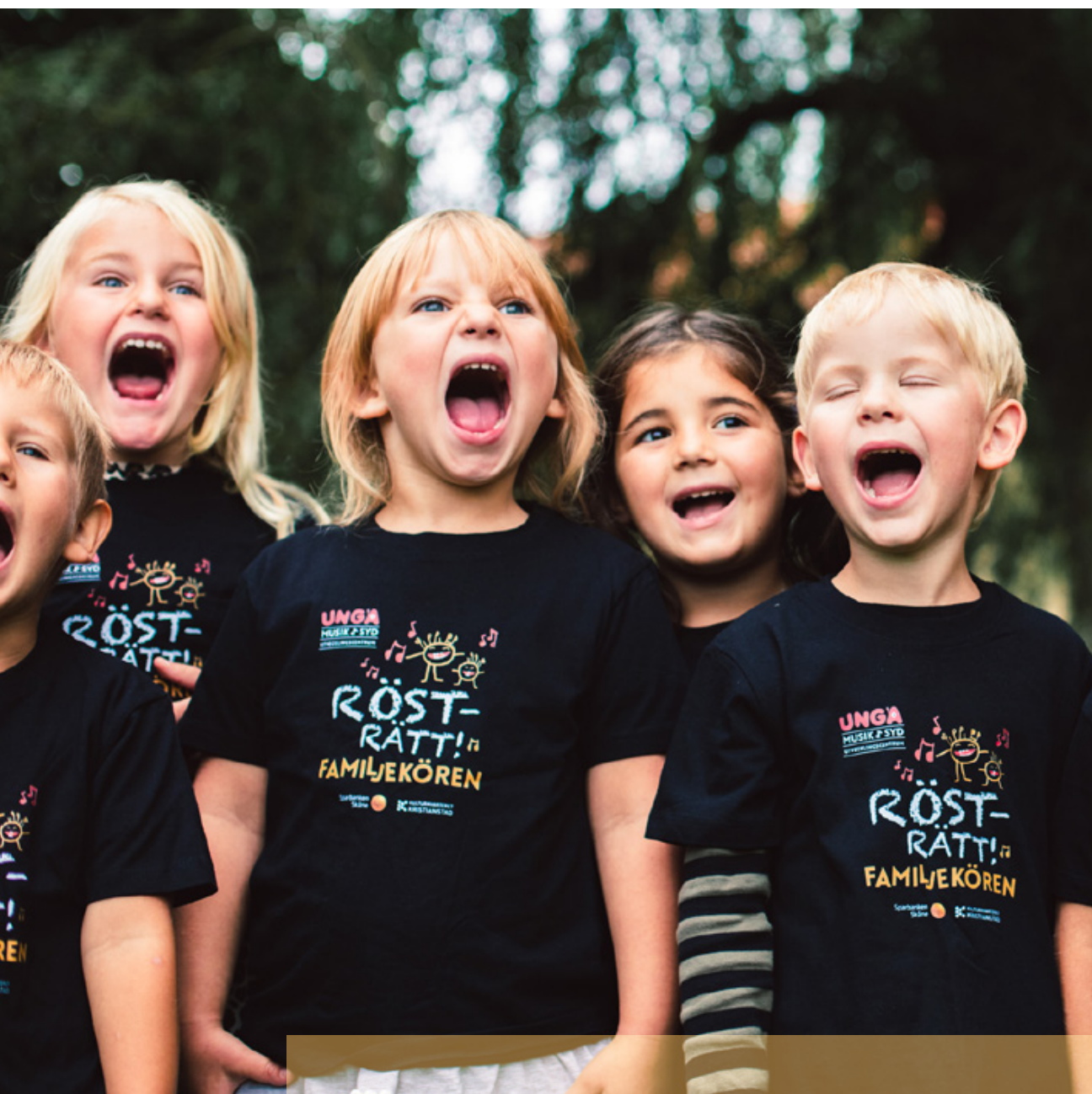
Rösträtt – sång på förskolan är ett projekt som drivs av UNGA Musik i Syd.