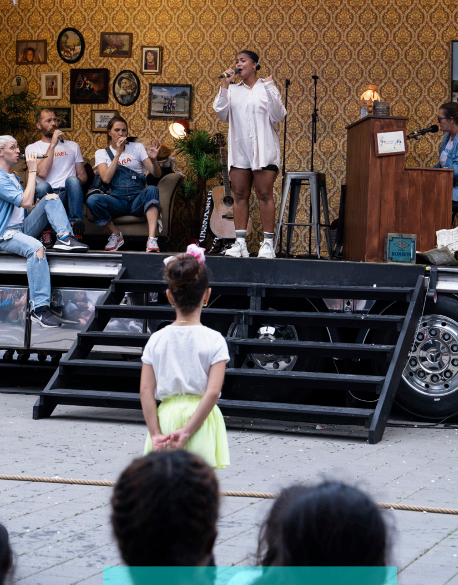
Malmö Opera på lastbilsturné i Skåne – en viktig del av deras regionala uppdrag..