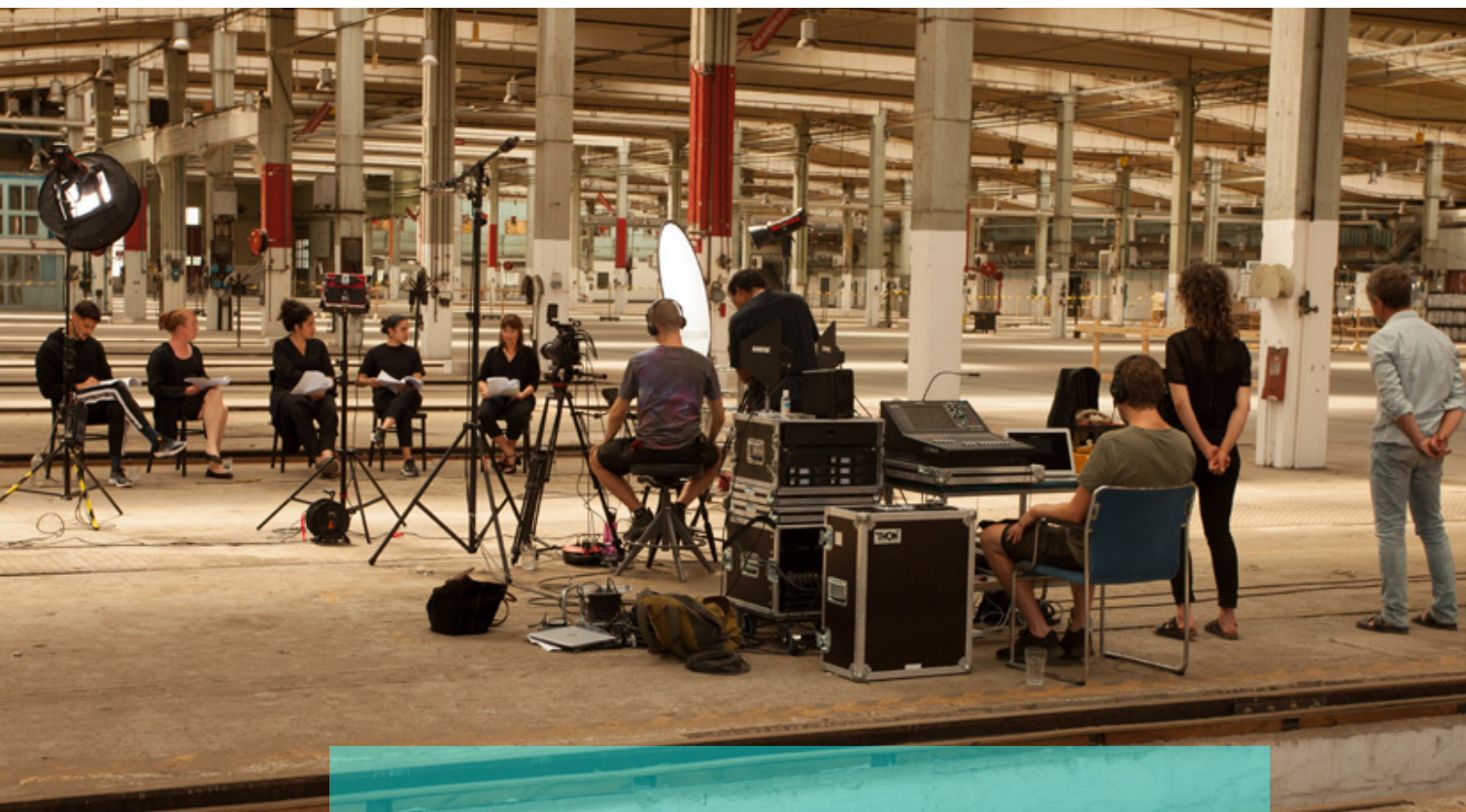
Läsning av Alexandra Pascalidou's bok "Mammorna", arrangerat av Södra Communityteatern och Sommarscen Malmö, i samarbete med In-Discourse och Culturestream.

Satsningar som ger kultursektorn möjlighet att utvecklas är också en satsning på folkhälsa och social hållbarhet. Delaktighet och medskapande skapar möjligheter till lärande och social inkludering. Det bidrar till stärkt självkänsla, personlig utveckling och välbefinnande, faktorer som är betydelsefulla för framtidstro och livskvalitet. I synnerhet bland äldre är ensamhet och isolering ett växande problem. Deltagande och delaktighet i kulturlivet kan stärka hälsan, erbjuda sociala sammanhang och vara en väg till ett fortsatt rikt liv för äldre. Kulturen kan bidra till fler friska år och att människor behåller sina förmågor längre.