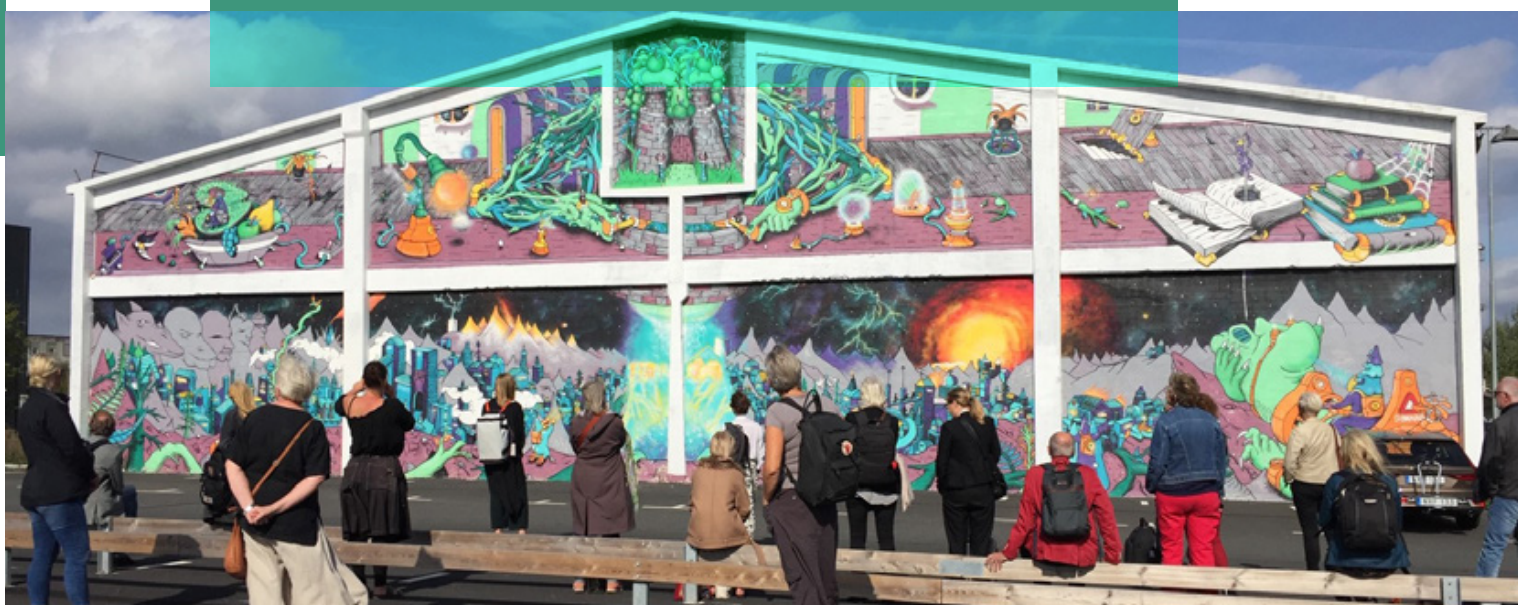
Kim DeMånes väggmålning "Abstrakt Komiks Palas", Ifö Center i Bromölla.

Region Skånes strategi för gestaltad livsmiljö – arkitektur, form och design syftar till att området ska stärkas för att ge förutsättningar för goda och hållbara livsmiljöer ur såväl ekonomiskt, socialt och miljömässigt perspektiv. Genom att agera förebildligt som offentlig aktör kan Region Skåne skapa legitimitet, relevans, flytta positioner, samla aktörer och driva ett strategiskt utvecklingsarbete inom ramen för gestaltad livsmiljö.