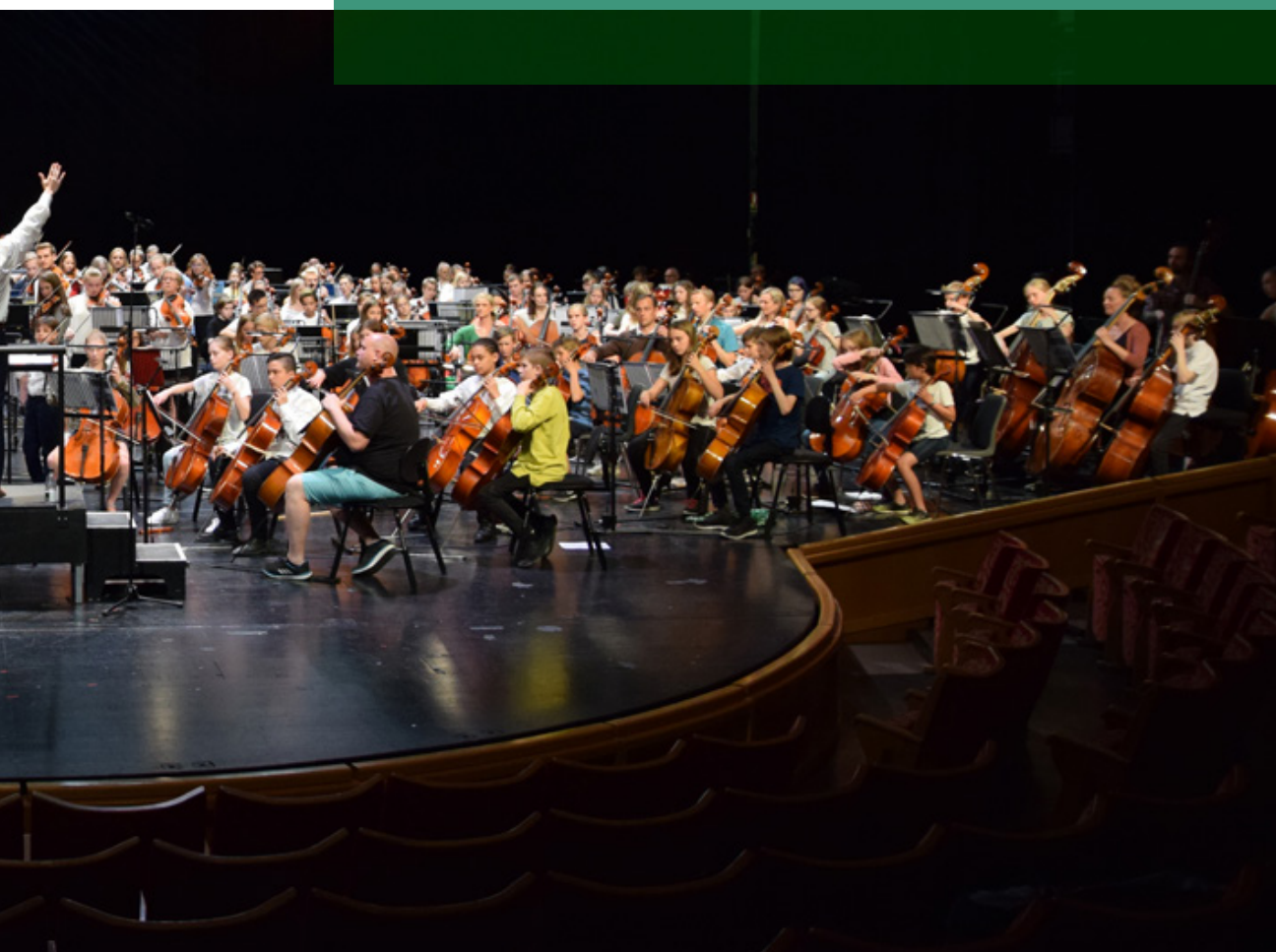
Stråckduell på Malmö Operas stora scen.

Region Skånes kulturförvaltning initierar och driver utvecklingsarbete på uppdrag av kulturnämnden. Kulturförvaltningen utformar och utvärderar insatser utifrån de kulturpolitiska målen och strategierna, samt handlägger, följer upp och utvärderar stöd till kulturinstitutioner, det fria professionella kulturlivet och kommuner samt redovisar statliga medel till Statens kulturråd.