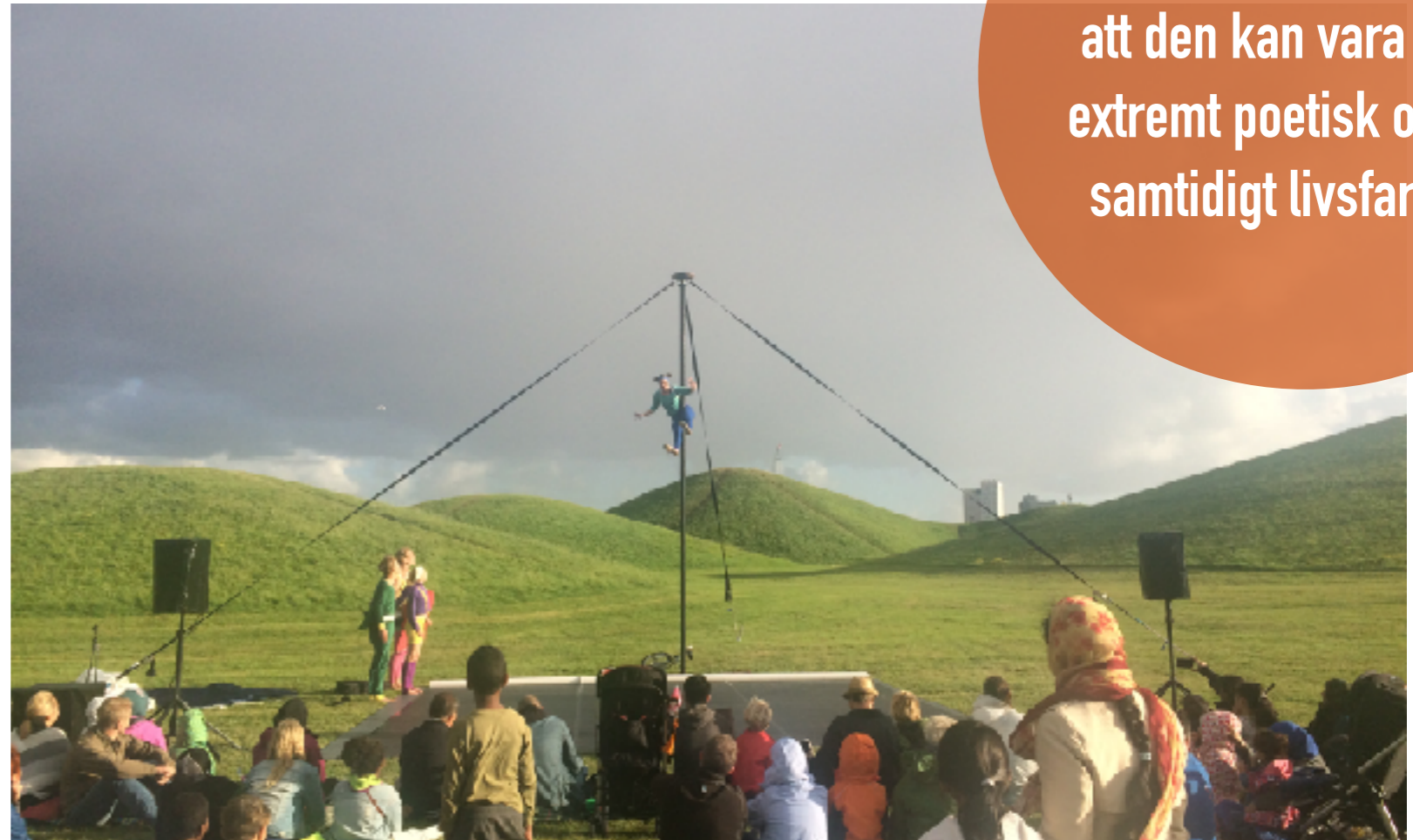
Kompani Hint, Malmö Sommarscen, 2016, Egen bild.

Malmö Live Konserthus (MLK) är en social och kulturell mötesplats i Malmö som är öppet för alla generationer och genrer. MLK har två scenrum väl