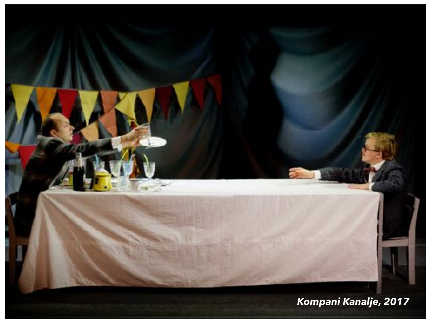
Kompani Kanalje, 2017