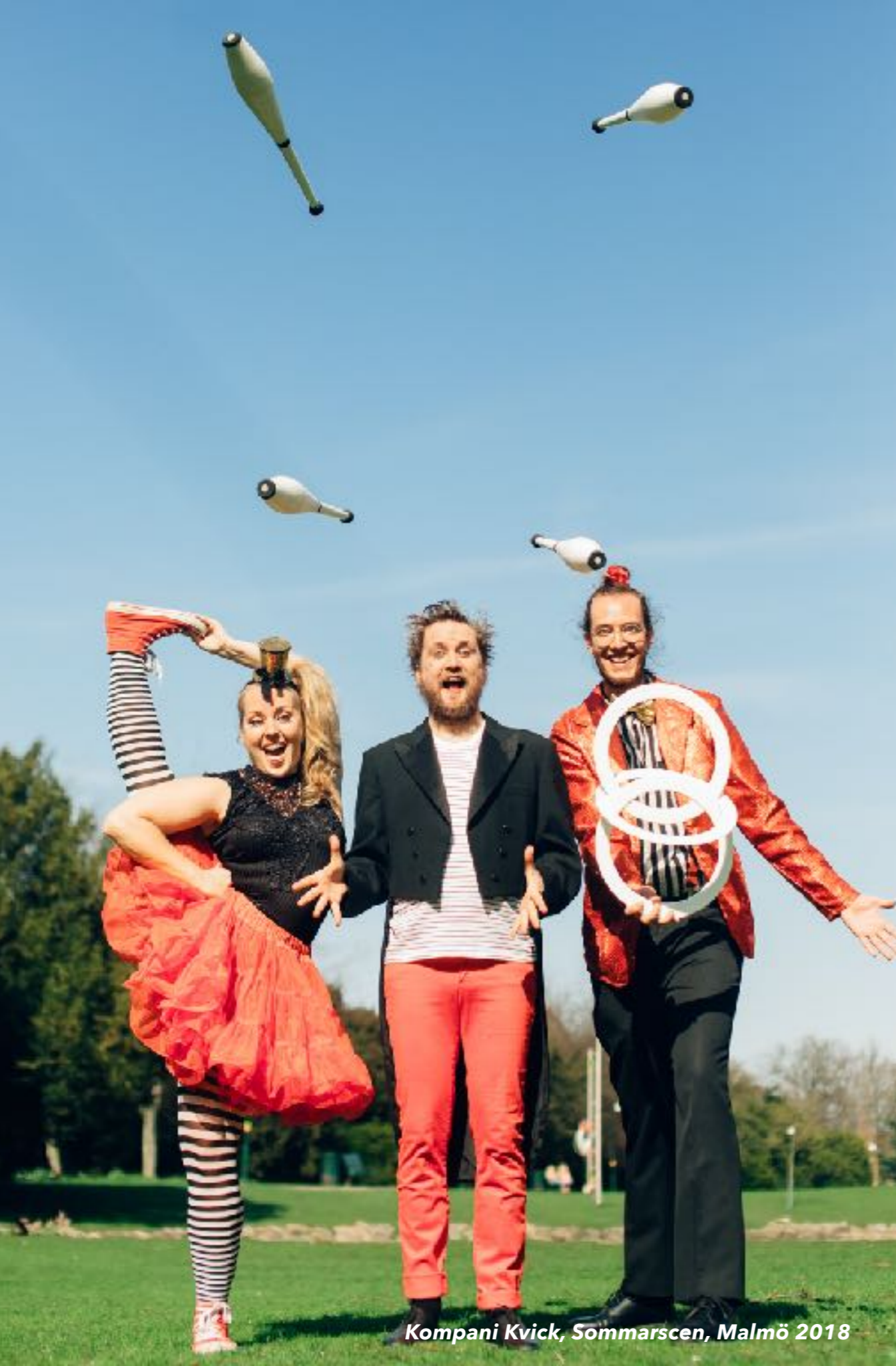
Kompani Kvick, Sommarscen, Malmö 2018

De som skapar cirkus upplever att det finns en avsaknad av kompetens kring deras konstform hos Region Skåne såväl som andra bidragsgivare. Samtida cirkus ses ofta som en parentes till dans och teater, utan kompetens för konstformens olika uttryck, historia, inneboende värderingar och discipliner. Det skapar problem för utövare när det inte finns spetskompetens att bedöma deras arbete.