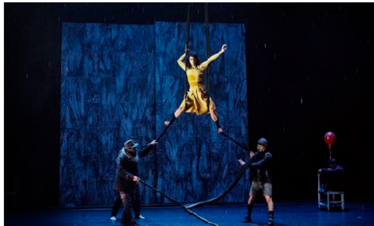
Cirkus Cirkör och Malmö Stadsteater