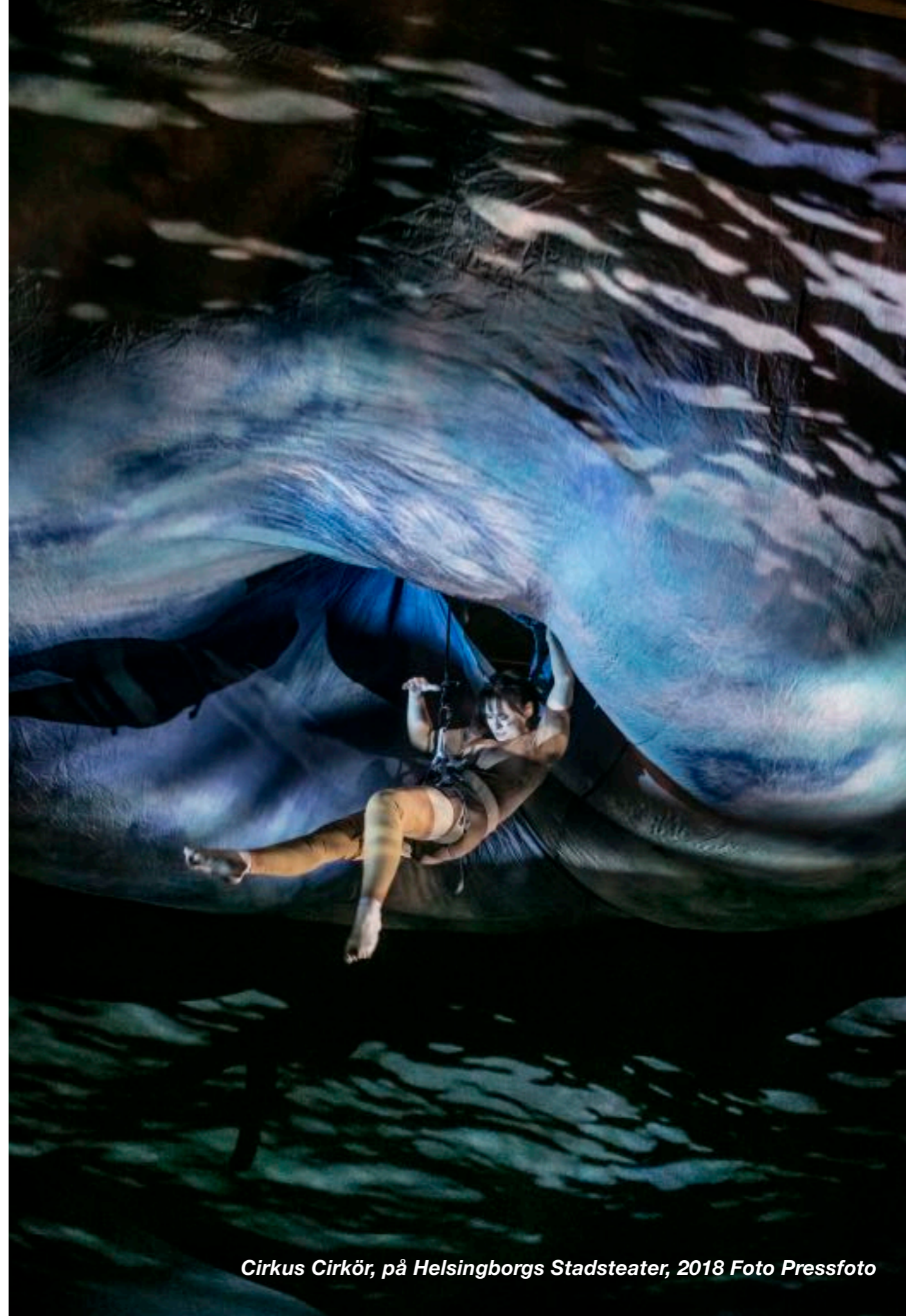
Cirkus Cirkör, på Helsingborgs Stadsteater, 2018

Eftersom nationellt sammanställd statistik inte finns tillgänglig för cirkusområdet (pga. att cirkus räknas in under dans/teater/scenkonst) är nationella siffror hämtade från Manegen, Sveriges branschorganisation för cirkus, varieté och gatupformance.