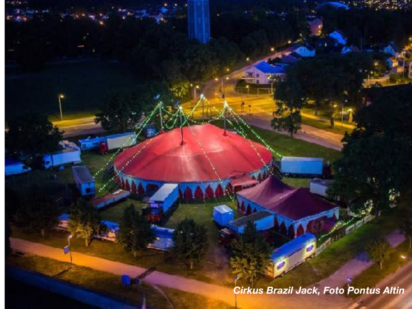
Cirkus Brazil Jack

Brazil Jack turnerar omfattande, bara i år har de varit i 150 städer samt spelat 170 föreställningar i Sverige. Något som de flesta samtida cirkuskompanier bara kan drömma om.