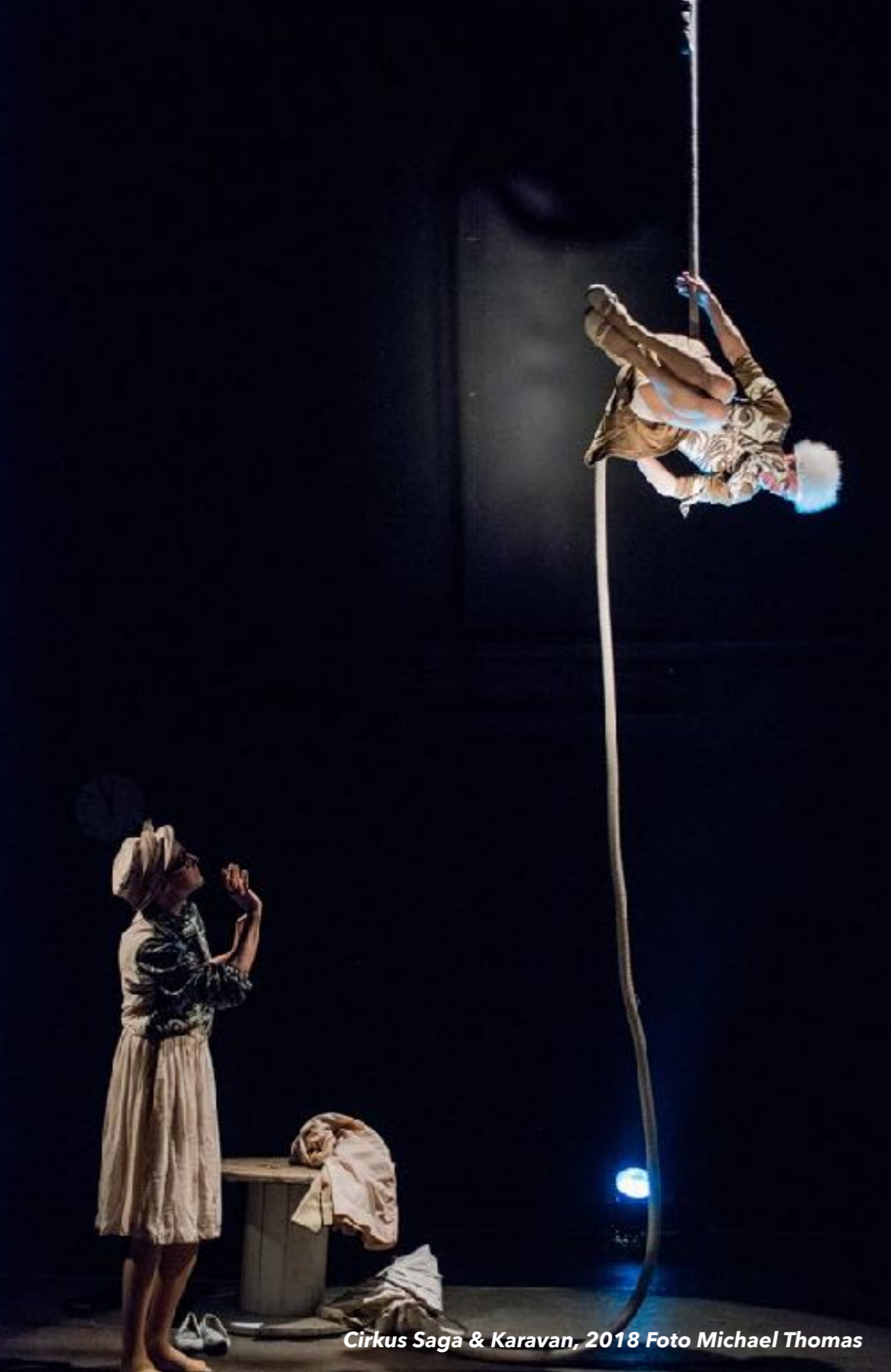
Cirkus Saga & Karavan, 2018