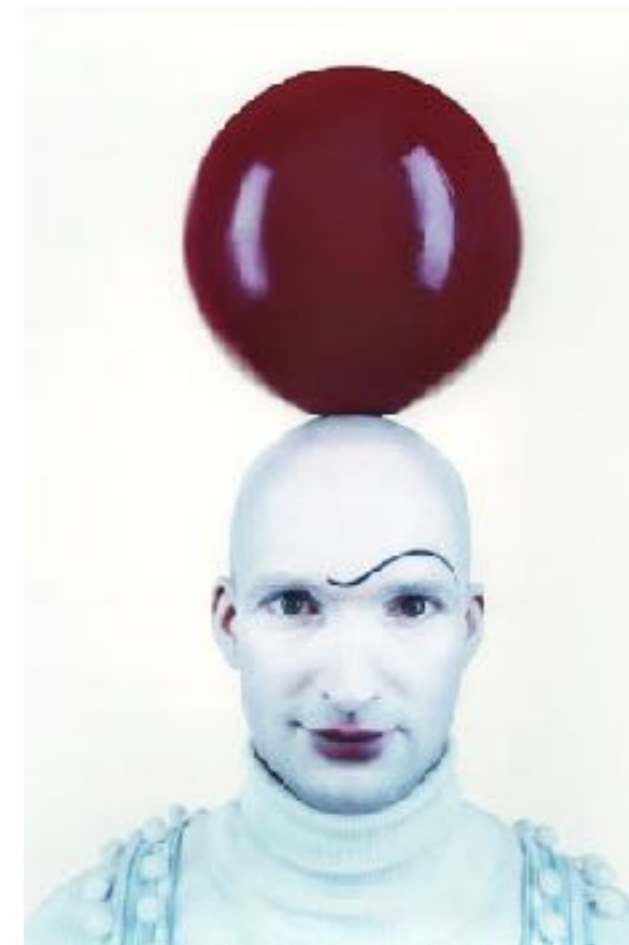
Cirkus Cirkör, Foto Mattias Edwall

“Malmö/Köpenhamn har alla möjligheter att ur ett kulturellt-och ett turistperspektiv, bli ett “nordiskt Barcelona” - Politikerna i Barcelona har förstått att kultur kan vara väldigt lönsamt eftersom tex turistindustrin älskar städer där kulturen (arkitektur, gatuteater osv) tar mycket plats.”