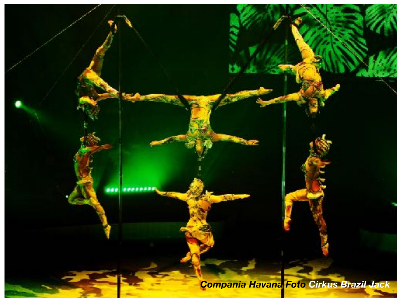
Compania Havana Foto Cirkus Brazil Jack