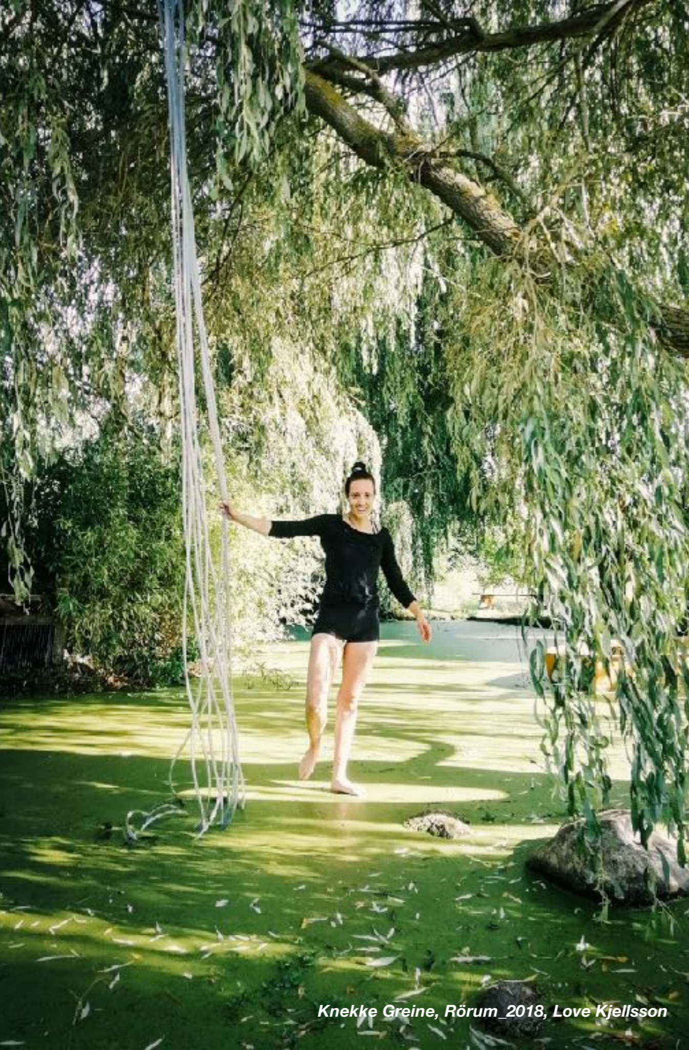
Knekke Greine, Rörum 2018, Love Kjellsson