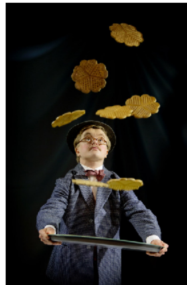
Kompani Kanalje, 2017

rör sig. Cirkusartister är oftast medlemmar i flera kompanier samtidigt, vilka skapar transnationella projekt på olika nivåer simultant. Ofta uppstår kompanier för att endast skapa en föreställning ihop vilken turnerar internationellt under en 3-årsperiod. Sedan löses inte sällan formationen upp eller omvandlas till nya konstellationer.