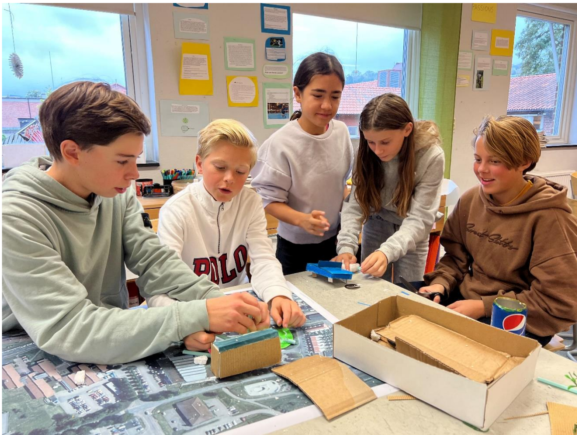
Elever från Strandängsskolan i Båstad 2021.