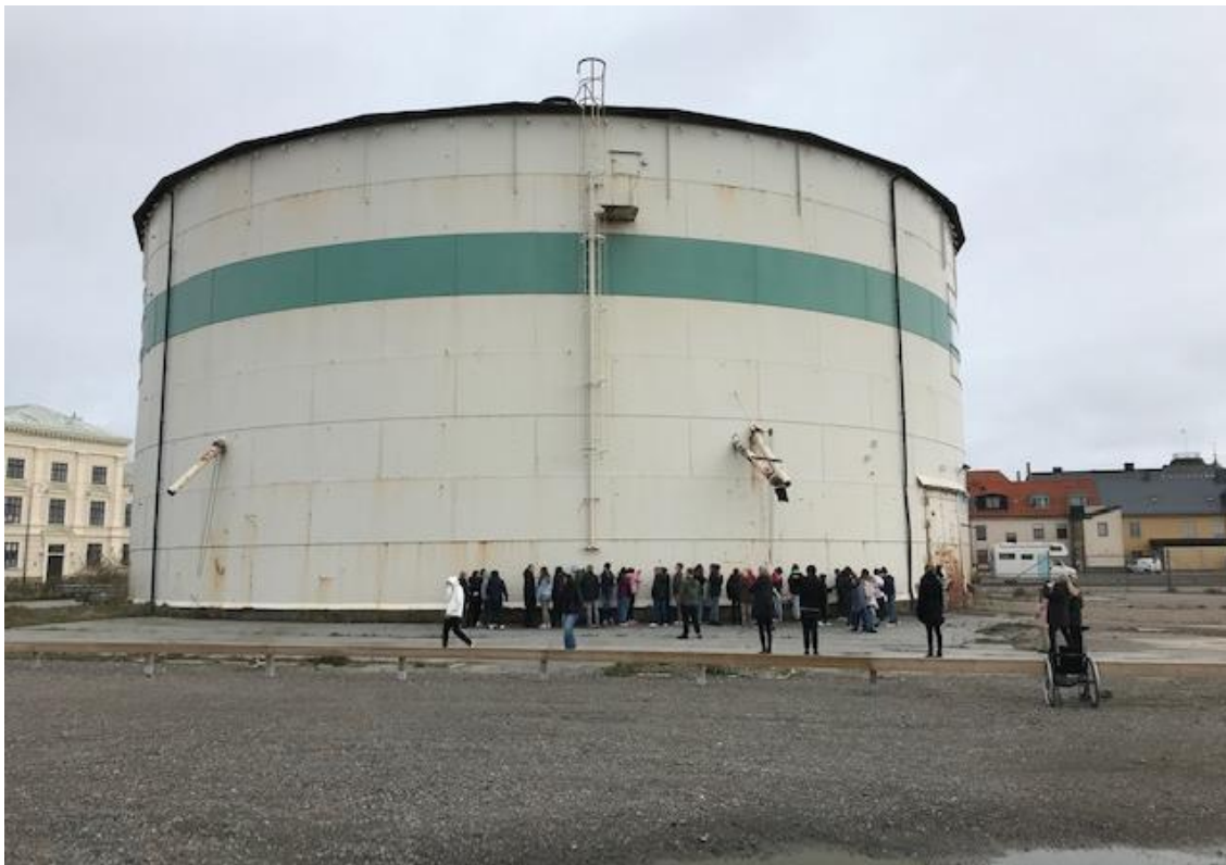
Elever på Västerportskolan i Ystad, på platsbesök i hamnen.